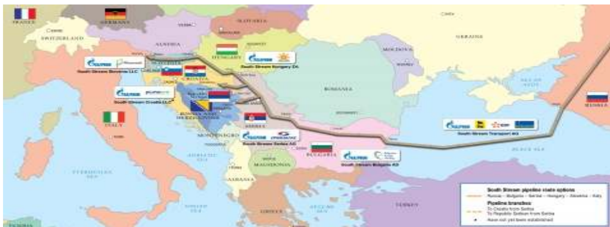
Η προτεινόμενη γραμμή χάραξης του αγωγού South Stream.

Σύμφωνα με τα τοπικά πρακτορεία ειδήσεων, η Ευρωπαϊκή Επιτροπή θεωρεί ότι δύο είναι τα βασικά προβλήματα του σχεδίου κατασκευής του South Stream: Το πρώτο έγκειται στο ότι στην εταιρεία South Stream Bulgaria έχει ανατεθεί ο σχεδιασμός, η χρηματοδότηση, η κατασκευή και η διαχείριση του αγωγού, με αδιαφανείς διαδικασίες, ενώ το δεύτερο πρόβλημα αφορά στις συμβάσεις με εταιρείες-αναδόχους, που φέρνουν συγκεκριμένες ρωσικές και βουλγαρικές εταιρείες σε πλεονεκτικότερη θέση.